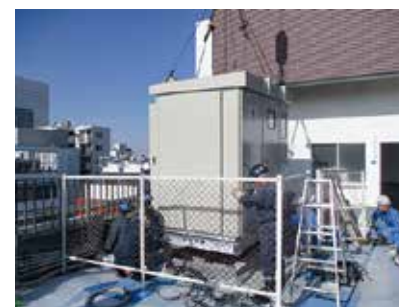
高圧受変電設備工事