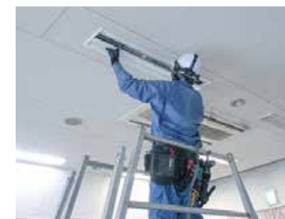
電灯電力設備工事